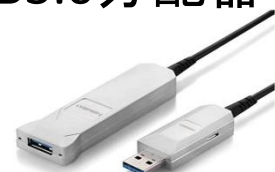
高速延長光ケーブル「HU3Hシリーズ」伝送距離50m HU3H-50